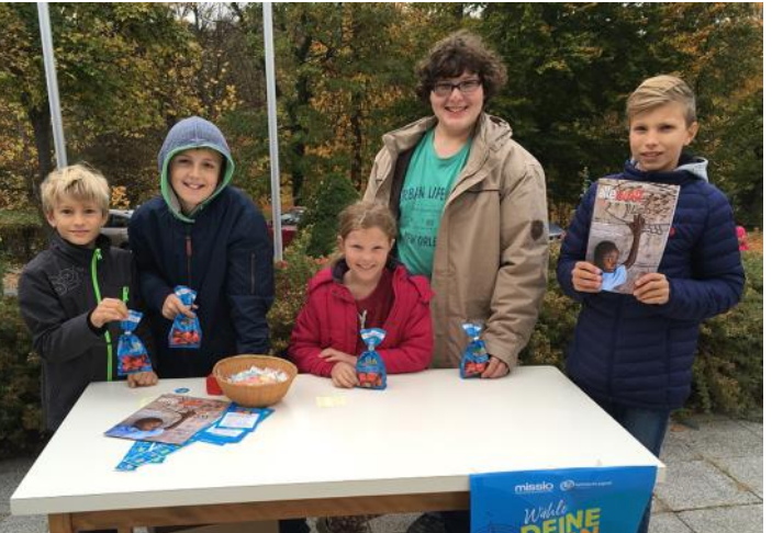
Am Sonntag der Weltkirche (22.10.) verkauften Firmlinge und MinistrantInnen nach dem Gottesdienst auf dem Kirchenvorplatz die FAIR gehandelten Schokopralinen und Gummibärchen von missio.