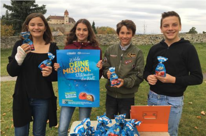
Firmlinge aus Bernstein machten beim Gottesdienst am 22. 10. die Lektorendienste und beteiligten sich am Verkauf der FAIR gehandelten Schokoprälinen von missio.